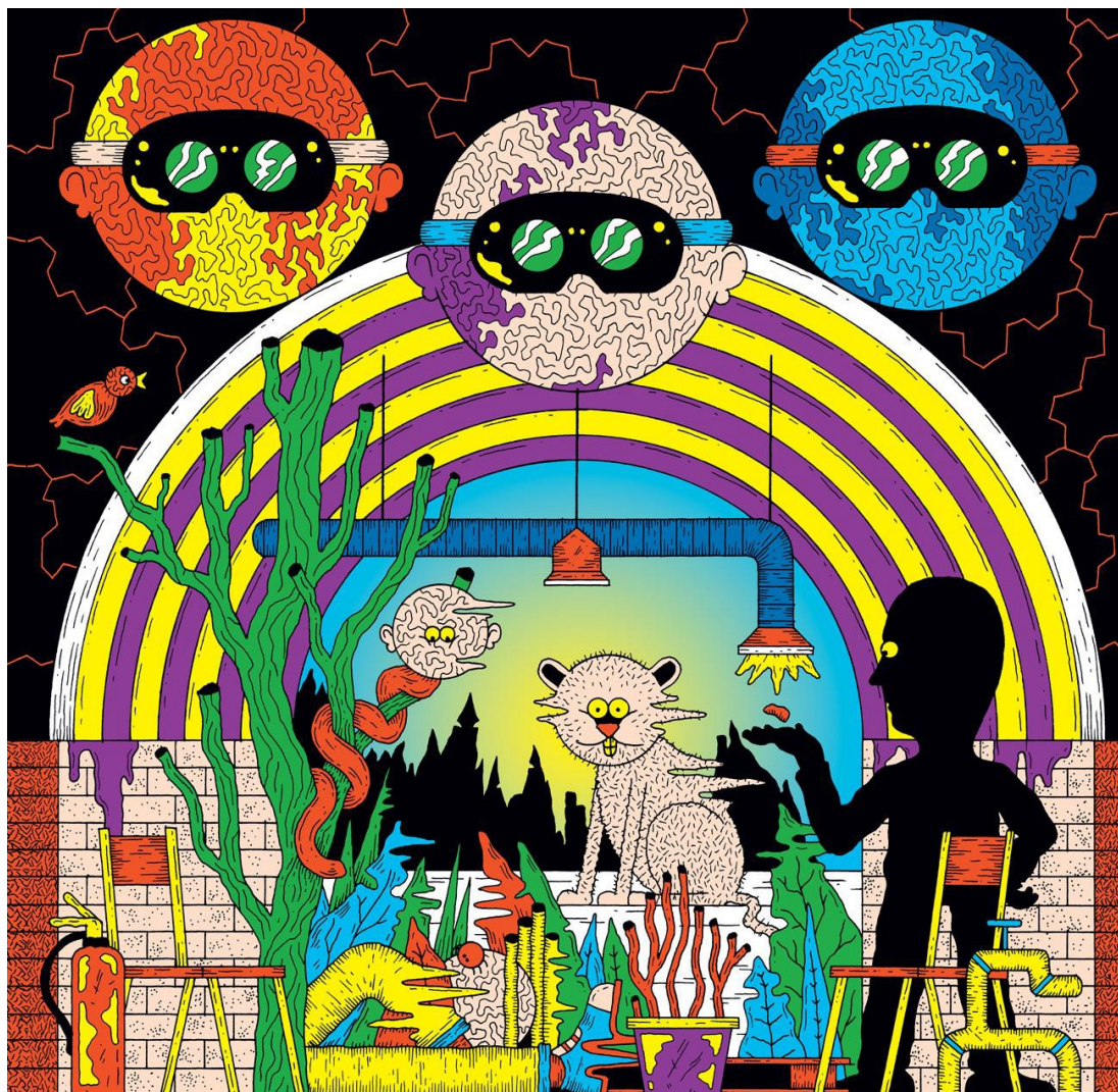
L'illustration du spectacle par Fräneck pour le programme du Théâtre Nouvelle Génération – CDN de Lyon

Objectif : Il s'agit de réinvestir les connaissances sur les 3 utopies pour lire l'image et interpréter les choix scénographiques du spectacle.