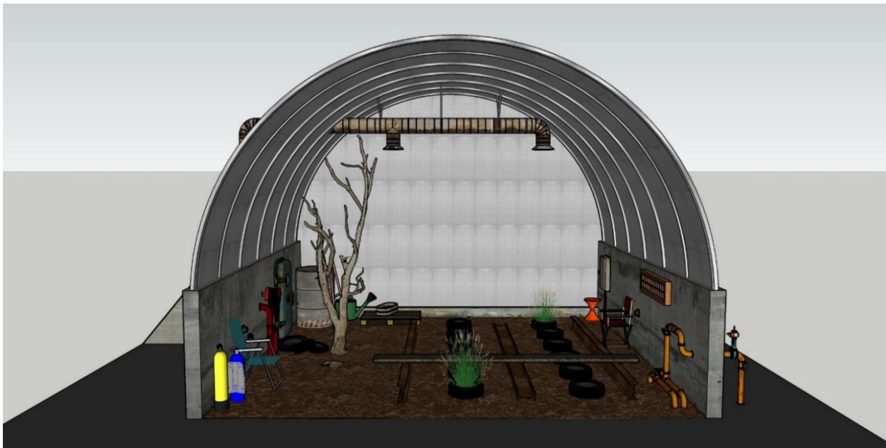
la scénographie © Nicolas Boudier

On peut comparer l'illustration de Fräneck avec la maquette 3D de la scénographie, et montrer comment l'illustration, par l'utilisation de couleurs vives, la saturation des éléments représentés dans le cadre, et la métamorphose des éléments (en particulier de la serre) offre un aperçu de la réalité augmentée qui se greffera sur la scénographie symbolique de Nicolas Boudier : la serre est le lieu de la germination – un laboratoire des possibles – où se développe l'imaginaire.