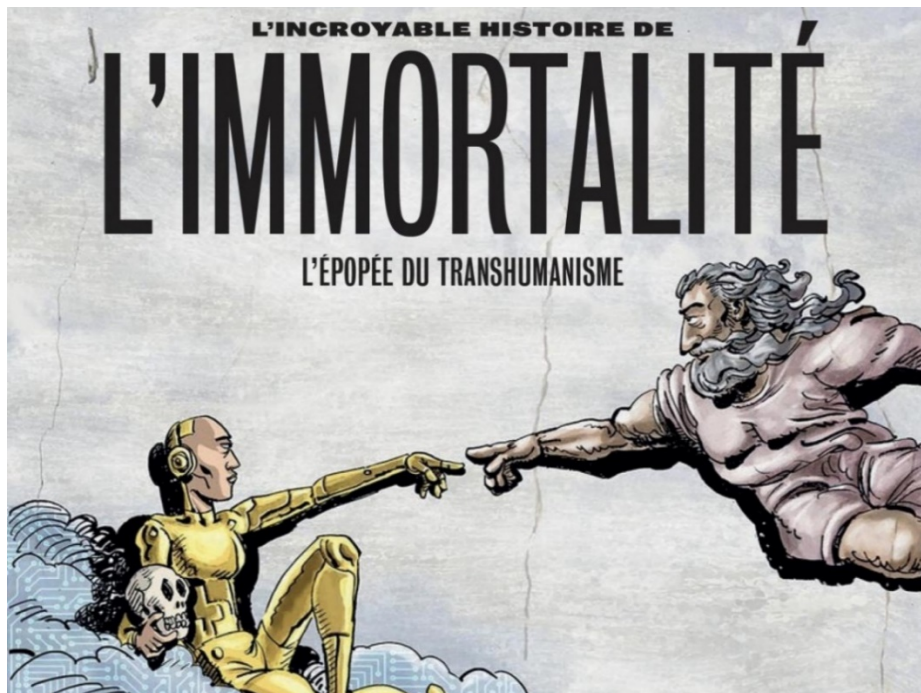
Couverture de L'Incroyable Histoire de l'immortalité , de Benoist Simmat et Philippe Bercovici Bande Dessinée sortie le 4 février 2021, Les Arènes.

Questions possibles : Lecture d'image : quelle célèbre œuvre cette couverture de bande-dessinée cite-t-elle ? Quelles modifications opère-t-elle ? Que nous dit-elle sur le transhumanisme ?